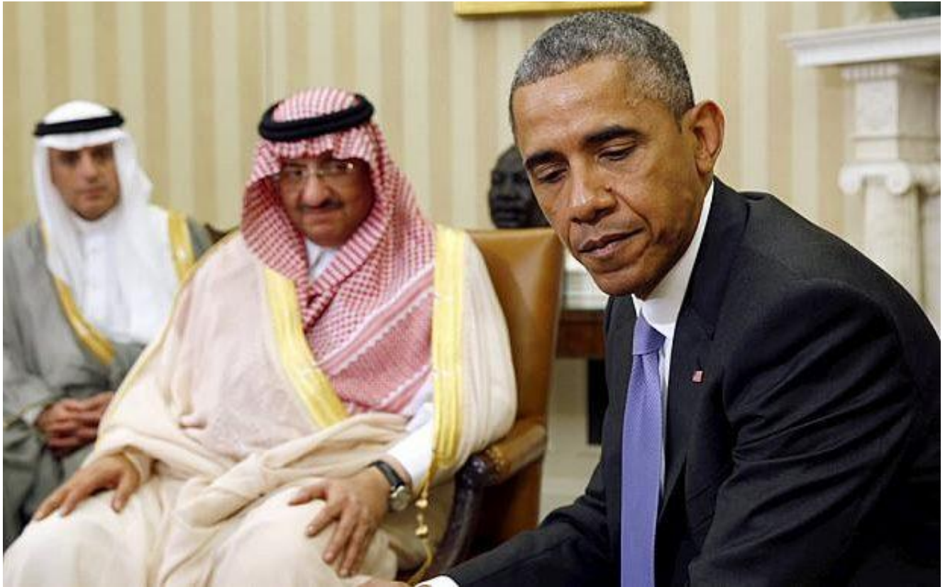
奥巴马在白宫椭圆办公室会见沙特阿拉伯王储穆罕默德·本·纳伊夫

可是，只管军售被削减，美国政府官员表现，美国仍会继续支持沙特向导的行动。美国称，将会向沙特提供偏重疆域宁静方面的情报，继续给联军飞机举行空中加油，对到场也门空袭行动的航飞行员举行训练，以尽可能制止平民伤亡。